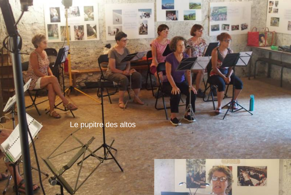
Le pupitre des altos