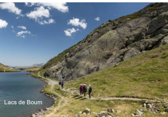
Lacs de Boum