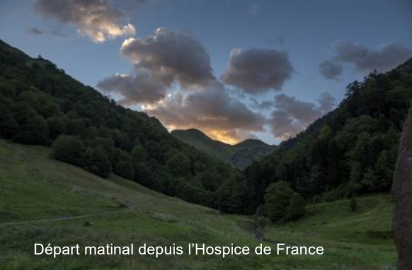
Départ matinal depuis l'Hospice de France