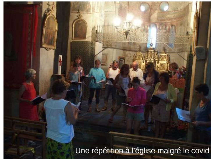
Une répétition à l'église malgré le covid