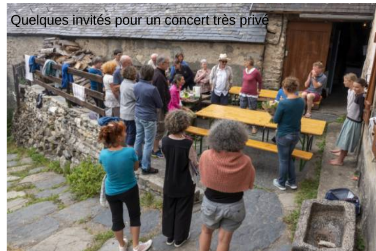
Quelques invités pour un concert très privé