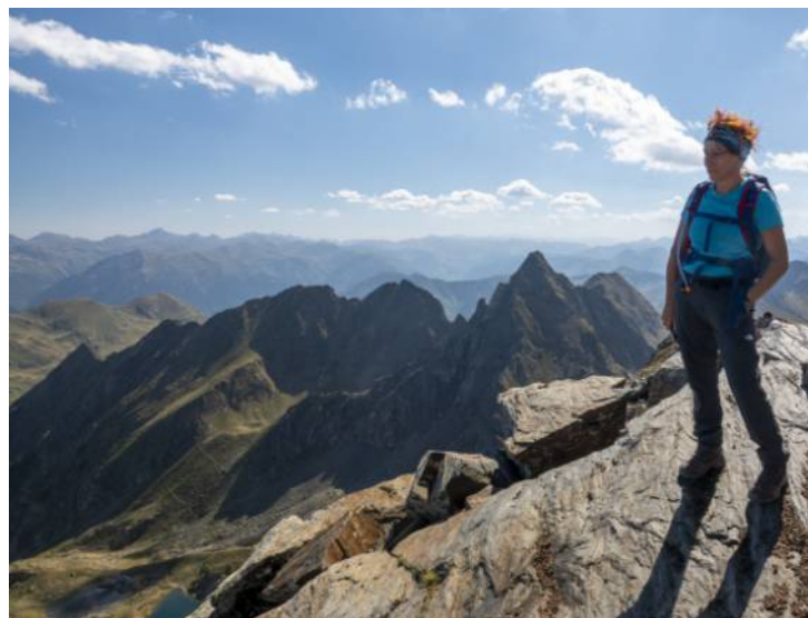
Tandis que d'autres font le tour du Pic de la Mounjoye (Campsaur)