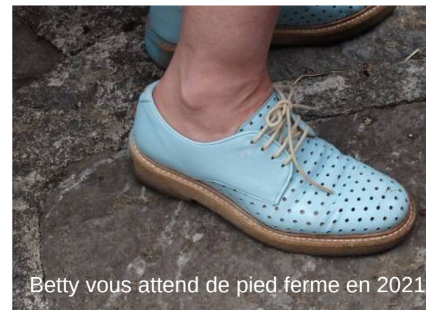
Betty vous attend de pied ferme en 2021